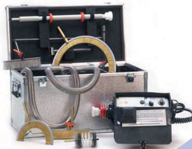
Keuze uit het brede aanbod van toebehoren